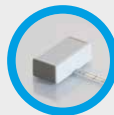
Rivelatore di pressione