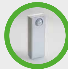
Rivelatore di movimento (niente foto / niente filmato)